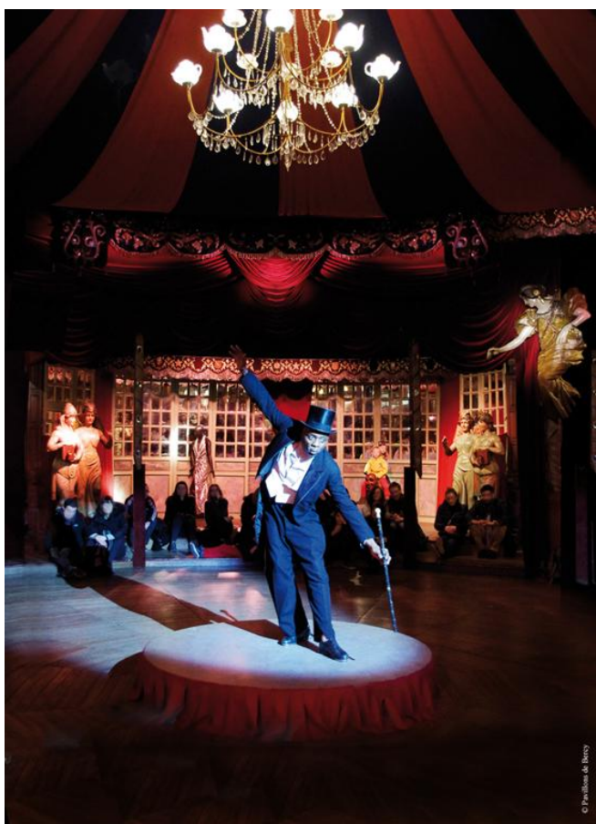
Spectacle au Magic Mirror

Renseignements : 01 43 40 16 22 ou www.arts-forains.com