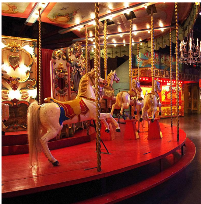
Musée des Arts Forains

« Doisneau en fête » au Festival du Merveilleux 26 décembre 2016 / 2 janvier 2017